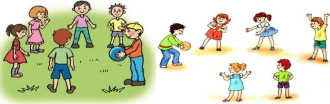
Ойын: «Лақтыр да, қағып ал»

Үзіліс : Затты лақтыру мен қағып алуға арналған ойындар «Лақтыр да, қағып ал»