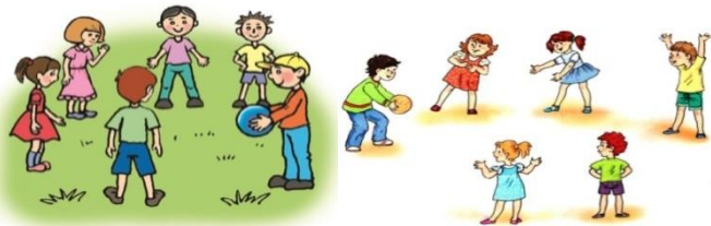
Ойын: «Лақтыр да,қағып ал»

Үзіліс : Затты лақтыру мен қағып алуға арналған ойындар «Лақтыр да,қағып ал»